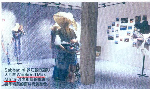
Sabbadini 梦幻般的摄影大片与 Weekend Max Mara 时尚别致的廓形与奢华精美的面料完美融合。

衣裙、裤装、衬衫、半身裙和配饰，蓝、白、粉的唯美色调与她镜头下经过拼接处理的精美自然风光图案浑然一体。▶